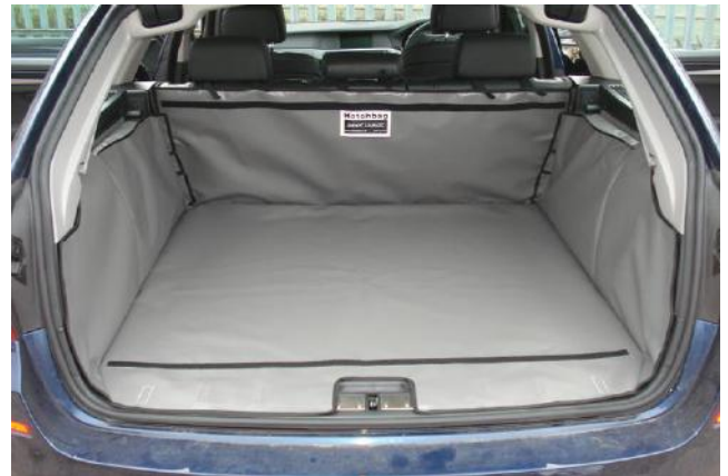
Bild: Kofferraumauskleidung mit Rücksitz Plus und vorbereitet für Sitzschoner und Stossstangenschutz